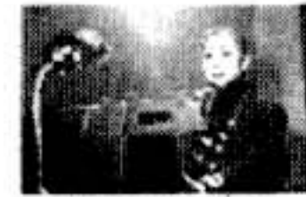
▲「走馬灯屋の通帳」より

■前回から引き続き上映の作品も大好評、何度も上映しているにもかかわらず反響の大きな「ダイヤモンドの月」。制作から10年を経ても、その衝撃はかわらない様です。スマートな演出が効いている小品「走馬灯屋の通帳」は、本当に印象深い作品。押さえたトーンの演技と、暖かで、それでいてウエットになりすぎない後味の良さが忘れられません。細かい小道具のアンバランスさがまた良い味を出しています。フィルム撮影のぼやけた感じも素敵な逸品です。