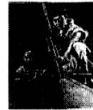
▲「ヒナラギ伝説」より

・撮影はかれこれ17年前!デジタル合成もない、CGも無い時代に製作された、日本インディーズファンタジー映画最大スケールの作品です。膨大なデザインワークやミニチュアワーク、セットなど、現場を想像して目眩を覚えますが「キャラのたったアクション演出(お客さまアンケートより)」で評判の大作。今回で最後の上映となります!ぜひお見逃しなく!