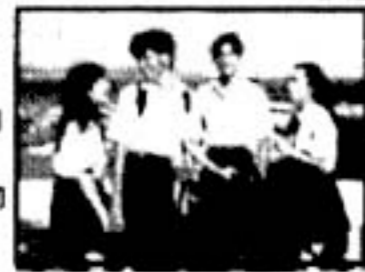
▲「いつもよりちょっと高いところ」/新井澄司監督より