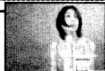
▲「ARAI SUMIJI SHORT CUTS/3:00」/新井澄司監督より