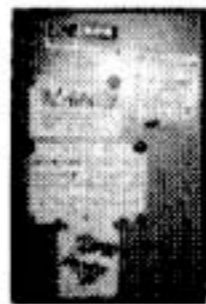
▲当日の会場ドア。割れたDVDが・・・

今回御覧になれなかった方も、どうか次回は、ある意味「プレミア上映会」の趣がありますので、ぜひ御来場下さい。今回は、本当に申しわけございませんでした。シネアストなど他団体の方もいらしてくださいました。本当にありがとうございました。