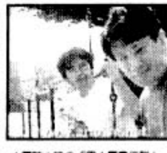
▲臨時上映の「男女青春伝説」。未ソフト化作品なので、お持ち帰りもできません。