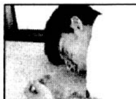
▲「あけぼの荘」/新井澄司監督より