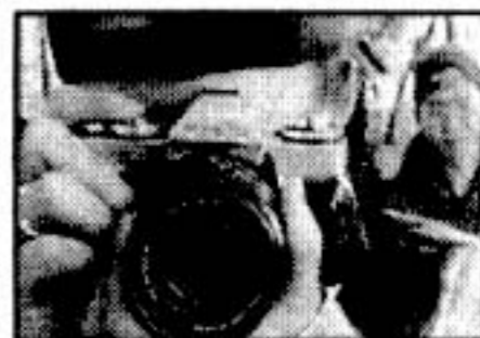
▲「フラッシュバック」/駒場 揚監督より