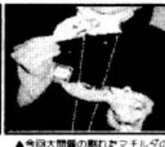
▲今回大問題の割れたマテルダのDVDです。次回、御来場の方に御覧をプレゼントいたします。

・「背もたれがなくて見にくい」という意見がたくさんありましたが、本当に申しわけございません。いろんな事情で、これが限界です・・・。「カンパをとればいいのに」という意見も頂きました。会場の問題など、確かにそういった手段でクリアできる問題でもありますが、この上映会のちょっとした「決心」みたいな物なので、次回3月まで完全無料です。あと1回(予定)ですが、最後までどうぞ宜しくお願いいたします。