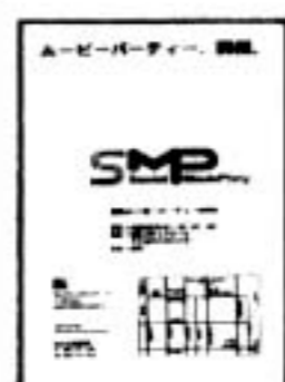
▲詳しくは各所で配布中の このチラシを参照のこと。

■日時: 2002/12/21-22 (土・日) ■場所: 仙台メディアテーク7Fスタジオシアター