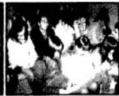
▲演劇部礼。今回は女性の方が 多かったです。