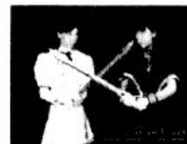
▲雄澤和也監督(ウィッチクローズ)より

隔月でインディーズの映画の上映会「i・fシアター」を開催なさっている仙台シネアストさんですが、次回11月の上映会はお休みするそうです。そのかわり来年1・2・3月の3ヶ月連続上映会(1)を決定! こりゃすごい! 上映作品はまだ交渉中だそうですが、先日上映されて話題になった「17歳」の(時空刑事グェッカーの...と云った方ははいという方もいらっしやるかも) 雄澤和也監督の新作なども予定されているらしいです。スタッフの皆さん、頑張って下さい! もちろん仙台の監督さんの作品もみれるはずですが、これから来年が楽しみです! 詳しい情報は、配布中のフリーペーパーや、下記のアドレスに!! 問い合わせ/ (あべ)