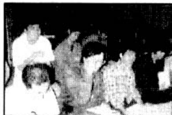
▲会場満員。すごい熱気でした。冷房が入って程です。(笑)

・「小さい会場で見ただけ、客席での一体感のような物があって良かった」という意見もあれば、「背もたれがなくてみづらい」という意見もあり、大変参考になりました。