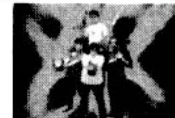
▲前野健一監督作品「BB/ダブルエイト」より

8/11(日) 「Shallまんがまつり」 怪獣・ロボット大進撃!! 仙台の映像作家・前野健一監督の作品の上映&トークショー。 Shall 5階 カンチエンジュンガ・ティーハウスにて 問い合わせ/