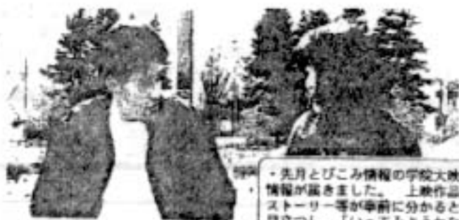
▲「恋に関する短いフィルム」より

■時/6月21日(日)12:00-15:00 ■所/141ビル6F141-4 仙台2974-4 ■入場無料