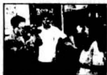
「わっつ・ごーいん・おん？」

★映研が部室をたたむことになり、留年生大木は卒業した同級生達に声をかけて同窓会を企画する。しかし社会人になった彼等は思うように時間がとれない…。去りゆく学生生活の寂しさと、社会へ出て行く不安を鮮やかに描いた青春佳作。五日市映画祭94グランプリ受賞作品。