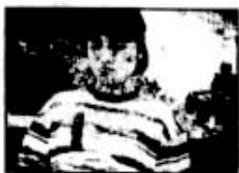
「きゅうりにラブレター」

★ター坊はきゅうりが大嫌い。八百屋のお父さんはそれを聞いてカンカンになってター坊を励ましてしまう。どうしても食べられないで困っていると目の前に強力な助っ人が現れた…。第9回伊丹映画祭グリーンリボン賞受賞作品。