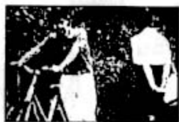
「コスモスの咲く頃」

出演：安田真奈 島田 敬 山口雅子 増田 暮 撮影：森 達之 脚本・監督 安田真奈